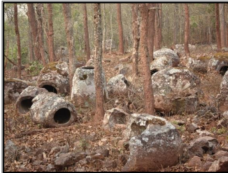
Foto 6. Plain Jar

Tempayan batu adalah sejenis objek yang hampir menyerupai bentuk sebiji tempayan, tetapi keseluruhan objek ini dibuat daripada batu. Tempayan batu mempunyai mulut yang bersaiz tidak besar berbanding dengan keseluruhan badannya yang lebih besar. Kebanyakan tempayan batu berbentuk panjang bulat dan memiliki dasar yang tebal. Purata saiz sekitarnya 1.5 meter tinggi dan diameternya sama, namun ada ketinggian yang boleh mencecah hingga ke 3 meter. Megalith jenis ini banyak ditemui di Vietnam. Di Laos, salah satu tapak penemuan tempayan batu yang penting ialah 'plain jar'.