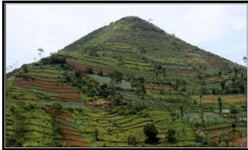
Foto 6. Punden Berundak Gunung Padang, Jawa Barat

Di Indonesia binaan ini dikenali sebagai Punden Berundak. Binaan ini bukanlah sebuah 'bangunan' sebaliknya merupakan upaya pengubahsuaian oleh masyarakat setempat dengan membentuk struktur bertingkat dengan memotong lereng bukit seolah membentuk seperti tangga yang bersaiz besar. Persekitaran kawasan ini seolah membentuk sebuah taman yang mengelilingi sebuah bukit kecil dengan susun atur batu yang membentuk tangga dengan puncaknya terdapat sebuah candi atau tempat pemujaan roh nenek moyang. Antara bahan utama yang digunakan untuk membina batu ini ialah tanah dan batu pelbagai saiz. Bangunan batu ini juga terdiri daripada batu-batu yang terukir dan tidak berukir. Dindingnya diperbuat dari batu-batu sama ada batu besar, batu-batu kecil ataupun kepingan batu berukir. Ciri binaan ini juga hampir sama dengan binaan struktur Piramid yang terdapat di Mesir, taman tergantung di Babylon dan sebagainya.