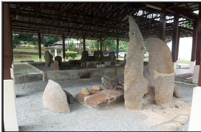
Foto 1. Batu Megalitik Pengkalan Kempas