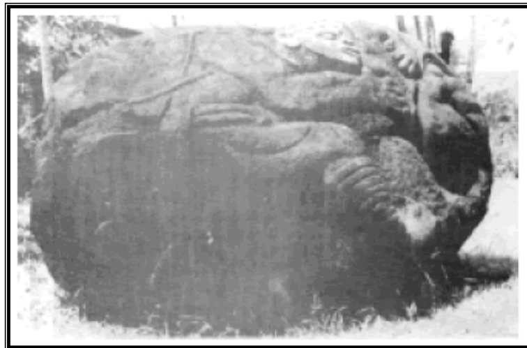
Foto 9. Arca Batu

Pembinaan arca atau patung biasanya adalah bertujuan untuk melambangkan nenek moyang mereka. Arca itu dipahat pada bongkah batu dengan bentuk dan gaya yang tersendiri. Kemudian arca itu diletakkan di satu-satu tempat yang sesuai di mana pada masa tertentu mereka akan datang untuk memuja atau menyembah dengan membawa hidangan atau sajian sebagai satu cara untuk menjamu kepada roh nenek moyang atau kuasa ghaib. Tradisi ini merupakan sejenis Megalith yang paling unik kerana kebanyakan daripadanya menggambarkan bentuk atau imej binatang seperti gajah, harimau., monyet atau sebagainya. Arca ini biasanya dipahat di atas batu tertentu yang sudah memiliki bentuk yang hampir menyerupai dengan bentuk yang ingin ditonjolkan. Para pendokong tradisi Megalith ini kemudiannya akan memahat arca dengan disesuaikan dengan bentuk asli batu tersebut. Malahan kadangkala ada juga yang diukir menyerupai imej manusia.