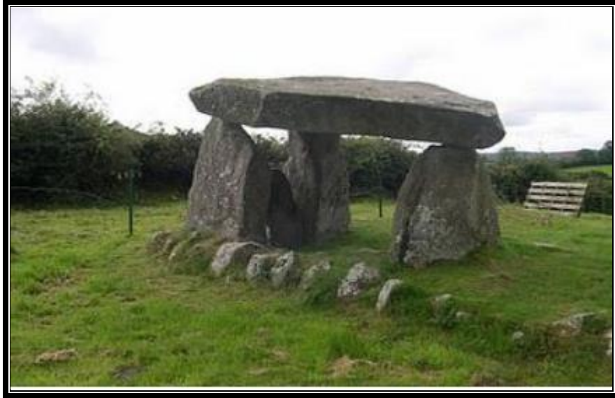
Foto 3. Dolmen

Ciri unik yang terdapat pada dolmen ialah strukturnya, di mana ia didirikan dengan meletakkan sebiji batu yang berbentuk rata di atas dua bongkah batu yang didirikan secara menegak. Ia boleh didapati secara berasingan atau berkelompok, umpamanya ialah tapak megalitik berbentuk dolmen pernah ditemui di Assam (India), Pulau Nias (Indonesia) dan lain-lain kepulauan Asia Tenggara. Selain itu, ada juga dolmen yang dijumpai bersama-sama dengan palong seperti di Pulau Pangung. Antara fungsinya mungkin sebagai tempat untuk meletakkan hidangan atau sajian bagi sesuatu upacara tertentu terutamanya untuk upacara pemujaan atau tugu peringatan. Kadang-kala terdapat juga kesan berupa kuburan (atau tempat pengebumian) di bahagian bawah dolmen.